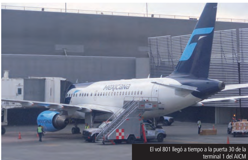
El vol 801 llegó a tiempo a la puerta 30 de la terminal 1 del AICM