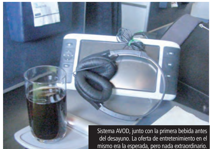
Sistema AVOD, junto con la primera bebida antes del desayuno. La oferta de entretenimiento en el mismo era la esperada, pero nada extraordinario.