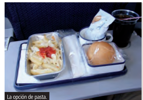
La opción de pasta.

el capitán se volvió a comunicar para informarnos que el tiempo seguía mal. Finalmente a las 10:34, pudimos comenzar el descenso y a las 11:13 tocamos pista. Algo notable es que en el anuncio de bienvenida/despedida se agradece de manera especial a los socios de MexicanaGO, sin embargo se olvidaron de anunciar el número de puerta a la que llegábamos y la temperatura. A las 11:24 se abrieron las puertas.