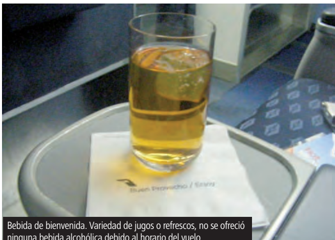
Bebida de bienvenida. Variedad de jugos o refrescos, no se ofreció ninguna bebida alcohólica debido al horario del vuelo.