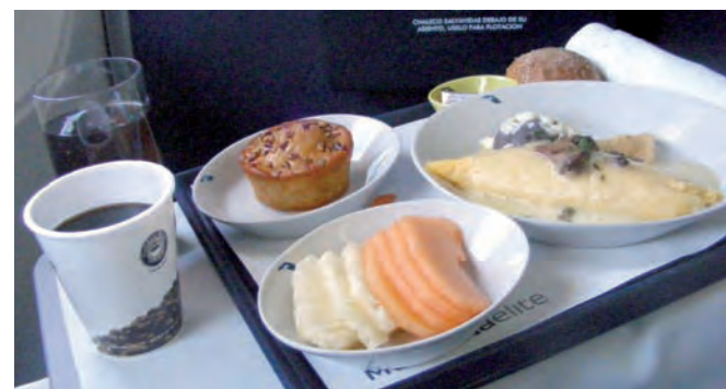
Catering de MexicanaElite Class, omelett de champiñones, muffin de nuez, pan y fruta fresca (melón y piña). La única elección que había que hacer era el plato fuerte (omelett o tamales). Acompañado de café y un refresco.