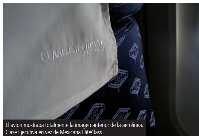
El avion mostraba totalmente la imagen anterior de la aerolínea. Clase Ejecutiva en vez de Mexicana EliteClass.