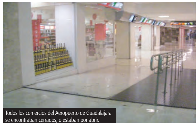
Todos los comercios del Aeropuerto de Guadalajara se encontraban cerrados, o estaban por abrir.