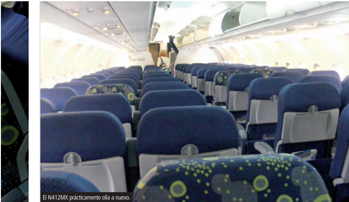
El N412MX prácticamente olfa a nuevo.

En conclusión, basado en esta experiencia, puedo decir que la diferencia entre clase MexicanaElite y Turista radica principalmente en objetos materiales y espacio en el vuelo más que en servicio a excepción de algunos aspectos que debido a los horarios no pude evaluar como son el bar y el salón VIP. Yo, en lo personal, no pagaría extra por este servicio, si no que lo tomaría cuando se me ofrezca como una cortesía. ●