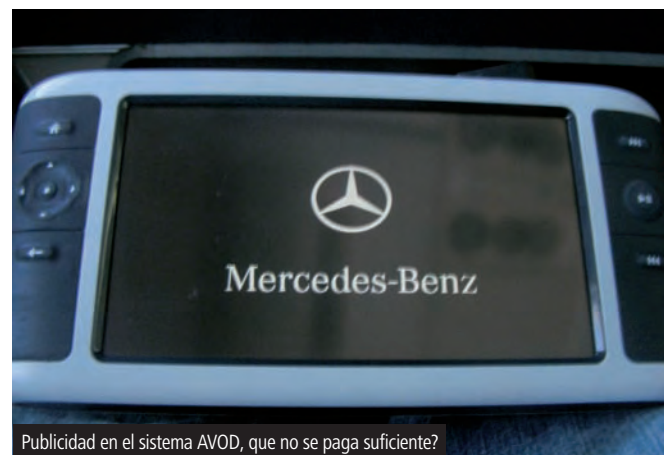
Publicidad en el sistema AVOD, que no se paga suficiente?