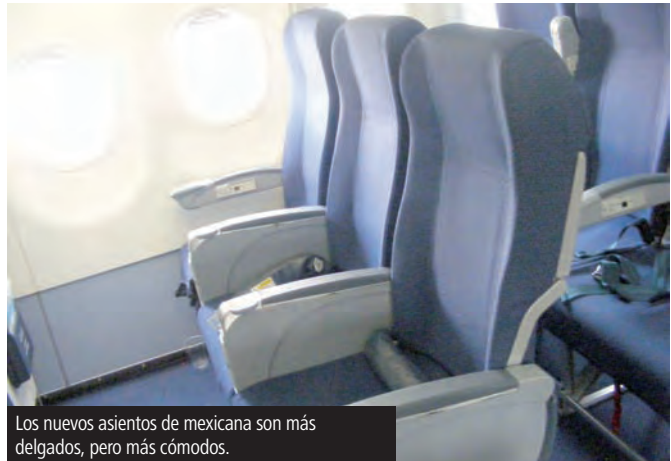
Los nuevos asientos de mexicana son más delgados, pero más cómodos.

tarde pasaron a ofrecer una segunda ronda de bebidas. Mientras esto sucedía, en las pantallas de toda la cabina de turista, se pasaban unos bloopers del mundial acompañados de publicidad y más adelante la película de "Cómo Entrenar a tu Dragón". Otras opciones de entretenimiento disponibles eran la re-