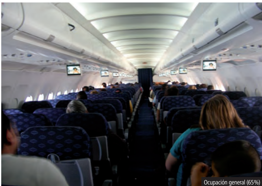
Ocupación general (65%)

Por primera vez en mi vida, no me fue permitido hacer "early check-in", por lo que tuve que esperar cuidando mis maletas hasta las tres de la mañana que reabrieron el mostrador. Tal vez Mexicana es una de las aerolíneas más importantes de éste aeropuerto, pero la fila para hacer check-in para pasajeros de clase Elite, no está bien señalizada. Dado a que no había fila, fue lo mismo hacer el check-in en la sección de Turista que en la de Elite, que tras preguntar descubrí dónde era. A las 4 se abrió el acceso a las salas de última espera y, para variar, todo estaba cerrado.