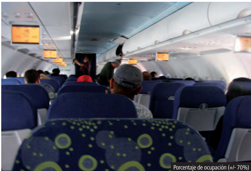
Porcentaje de ocupación (+/- 70%)