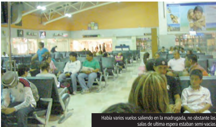
Había varios vuelos saliendo en la madrugada, no obstante las salas de última espera estaban semi-vacias