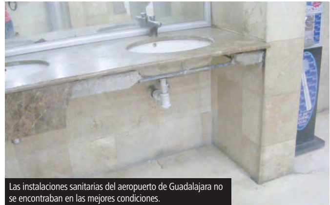
Las instalaciones sanitarias del aeropuerto de Guadalajara no se encontraban en las mejores condiciones.