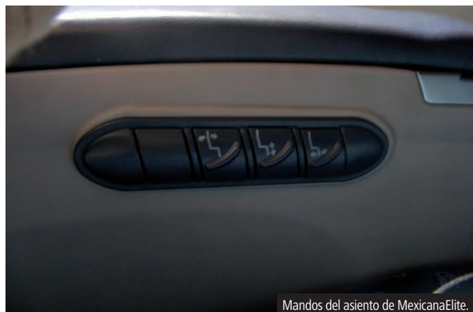
Mandos del asiento de MexicanaElite.