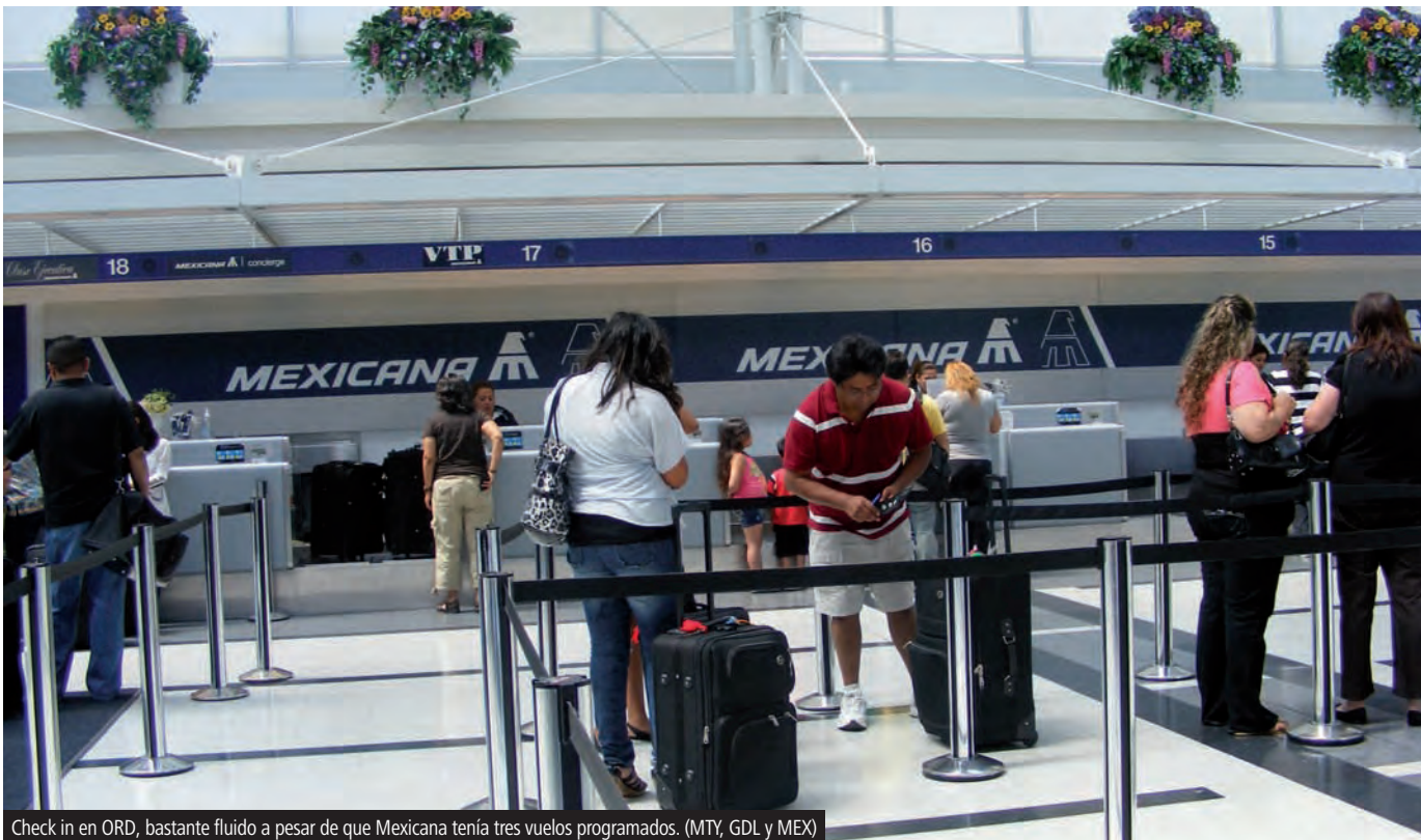
Check in en ORD, bastante fluido a pesar de que Mexicana tenía tres vuelos programados. (MTY, GDL y MEX)