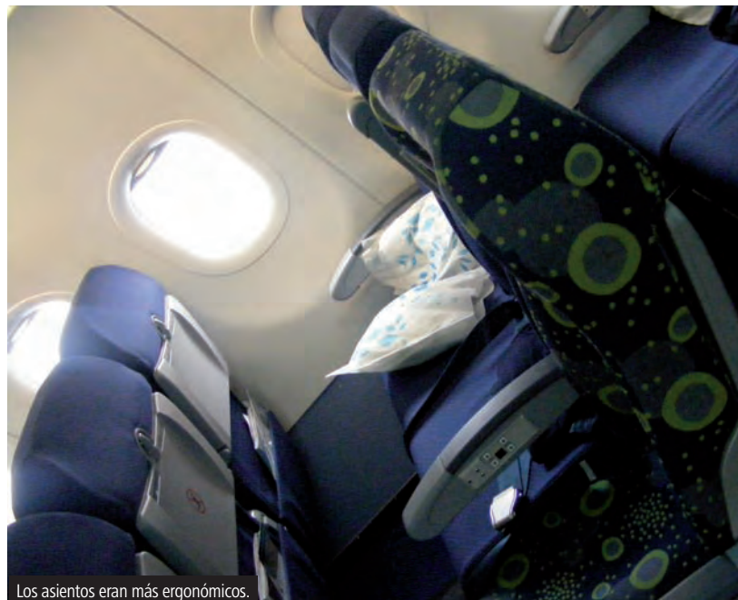
Los asientos eran más ergonómicos.

A las 2:32 despegó el vuelo 801 con destino a la Ciudad de México. A las 2:57 alcanzamos el vuelo nivelado y media hora más tarde pasaron los comisarios ofreciendo tanto bebidas como alimentos. Las opciones eran pollo con gravy y verduras o pasta, yo seleccioné el pollo que tenía excelente sabor. Algo que pude notar es que la carta de bebidas alcohólicas de un mes a otro cambió de manera muy extraña. Empezaron a ofrecer Bacardí 8 años en ambas clases y Bacardí Blanco sólo en Elite. Veinte minutos más