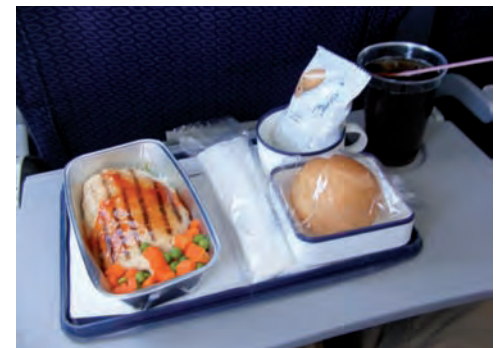
El servicio de catering ofrecido en el vuelo consistía de un plato fuerte (pollo o pasta) en este caso pollo con gravy y verduras pan y unas galletas. En cuanto a bebidas, el bar estaba totalmente abierto y los sobrecargos pasaron dos veces ofreciendo bebidas.

otra bebida y el sistema AVOD. El sistema AVOD de MexicanaElite es muy parecido al de cualquier otra aerolínea con la comodidad de que puedes tomarlo y colocarlo en el lugar de tu preferencia. Ofrece 10 películas de estreno, un capítulo de 4 series diferentes, videos musicales, 10 diferentes generos musicales y 3 videojuegos (reversi, tetris y millionaire). Tomé el sistema AVOD, lo exploré por 10-15 minutos y lo apagué. En lo personal, estos sistemas no