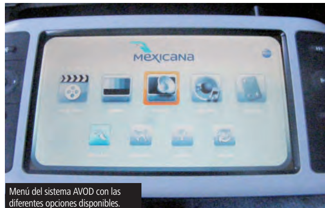
Menú del sistema AVOD con las diferentes opciones disponibles.

Con 7 minutos de retraso, comenzó el push-back y con ello se reprodujeron los videos de con instrucciones de seguridad. Tras el despegue (6:23) el avión alcanzó la velocidad y altura de crucero (6:45) y nos dieron más o menos una hora para descansar. A las 7:40 me ofrecieron