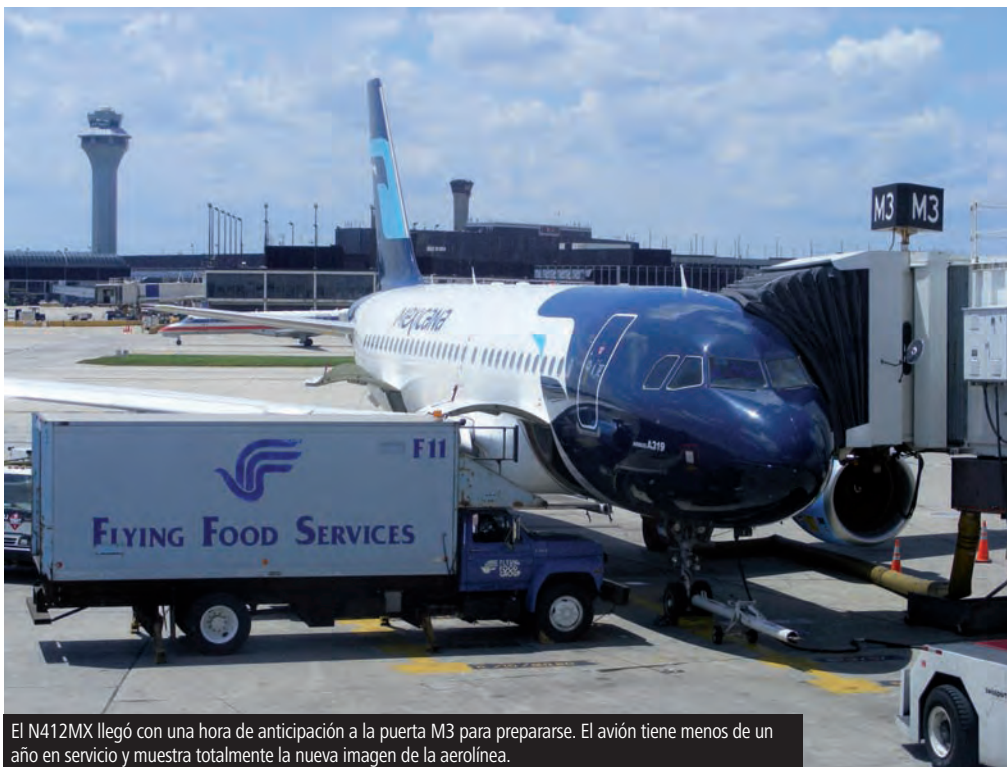
El N412MX llegó con una hora de anticipación a la puerta M3 para prepararse. El avión tiene menos de un año en servicio y muestra totalmente la nueva imagen de la aerolínea.