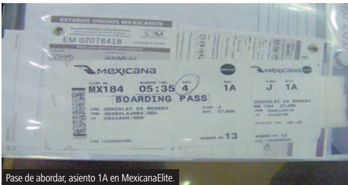
Pase de abordar, asiento 1A en MexicanaElite.