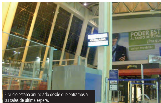
El vuelo estaba anunciado desde que entramos a las salas de última espera.

muy parecido al del sitio web de mexicana y pude elegir entre varias opciones de "tarifa". Por supuesto elegí la opción más "barata" de 15,000 puntos viaje sencillo (clase T), más adelante me fue requerida la información de pasajero y para terminar, el pago de los impuestos (20 dólares) con tarjeta de crédito. Cometí el error de querer hacer varias reservaciones con puntos a la vez en pestañas diferentes del navegador, lo que provocó que todas las sesiones caducaran, y más adelante me llevó a una confusión entre reservaciones. Para arreglar, tal