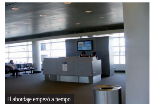
El abordaje empezó a tiempo.