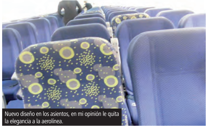
Nuevo diseño en los asientos, en mi opinión le quita la elegancia a la aerolínea.